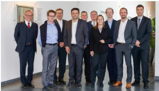
Security-Experten aus unterschiedlichen Bereichen diskutierten beim COMPUTERWOCHE-Round-Table Cloud Security über Sicherheitsfragen rund um die Cloud.